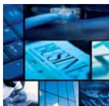
Software & Consulting