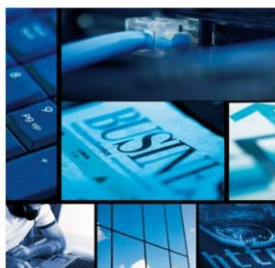
Software & Consulting