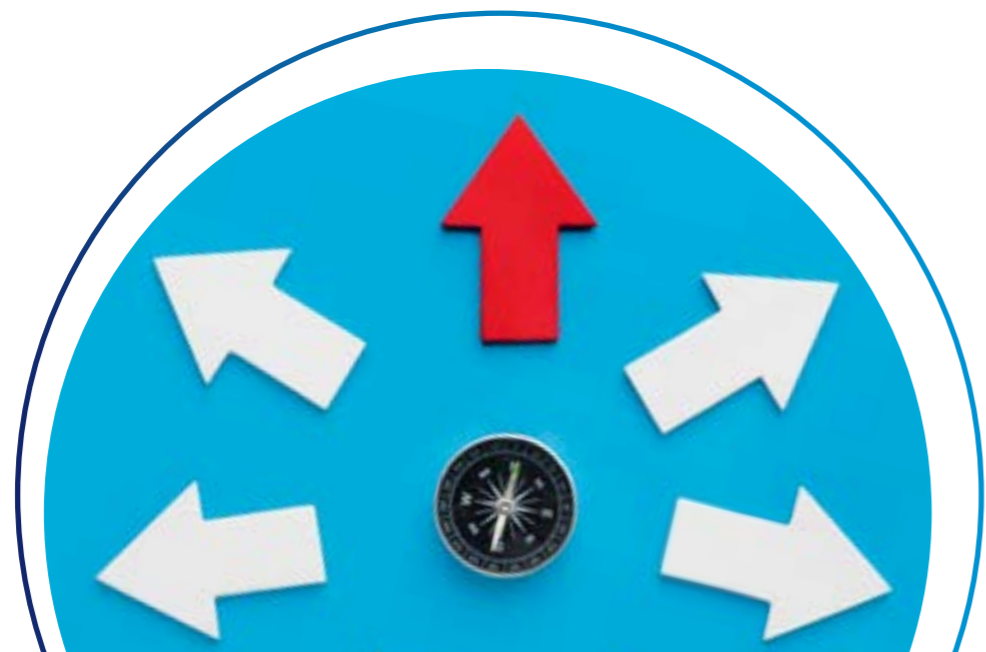
CBS Group Πωλήσεις 2010 - 2023

Στην Cosmos Business Systems ως εταιρεία υψηλής τεχνολογίας και έως Systems Intergrator, πιστεύουμε στη διαρκή ανάπτυξη και βελτίωση των αριθμητικών και ποιοτικών συντελεστών σε ταυτόχρονο και ισορροπημένο συνδυασμό. Αυτό οδηγεί στην επιτυχία.